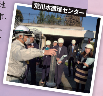
荒川水循環センター

修繕費確保のため、荒川左岸北部地域(熊谷市、行田市、桶川市、鴻巣市、北本市)と利根川右岸地域(本庄市、美里町、神川町、上里町)では、市町の負担金が増えることが決まりました。技術の進歩を公共インフラの再整備に繋げ、県民負担を少なくする努力をしています。