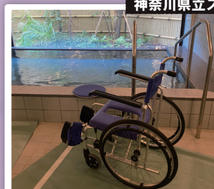
神奈川県立スポーツセンター