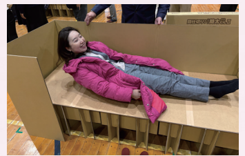
段ボールベッドを作成