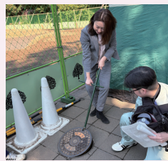
マンホールトイレの設置中