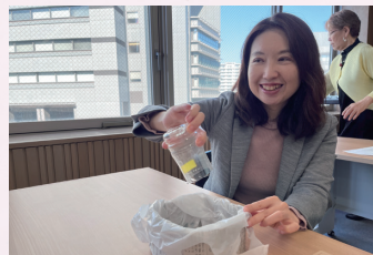
災害時のトイレ対策として凝固剤を用いて実験中