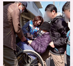
段差のあるところで車椅子の介助を