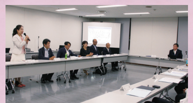
第二産業道路建設促進期成同盟会 知事・議長へ要望書提出

さいたま市から南は都内、北は桶川市まで、南北の要となる交通路が早期に事業化されるよう要望