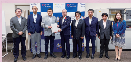
大宮北特別支援学校の 空調設備に関する要望書提出

大宮北特別支援学校のエアコンが故障し、PTAが応急措置として大型扇風機を購入していた件。早急に県へ対策を講ずるよう要望