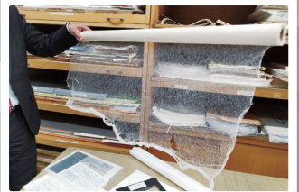
資料の修復に使う和紙は何種類も