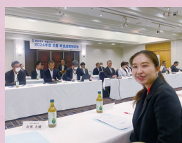
連合埼玉 市長・町長政策懇談会

さいたま市役所の移転に伴い、現庁舎地の利活用と浦和のまちづくりを考えるカフェが開かれ、市の職員さんと意見交換