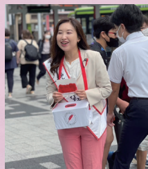
赤い羽根募金活動