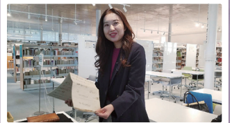
貴重な資料である 安土桃山時代に書かれた源氏物語の 写本を見せていただきました