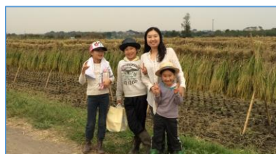
私も田んぼ保全活動に参加してきました

低地の農地、とくに水田は、 農産物生産 の場であると共に、 ヒートアイランド現象の緩和 、多様な 生き物の宝庫 、そして、いざという時は 地域を守る場 にもなってくれます。