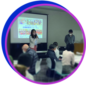
主権者教育フォーラムを主催し、多世代にわたる意見交換の場を創出