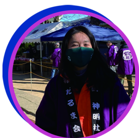
地元神明社のお祭りや福ダルマ会のお手伝いも積極的に