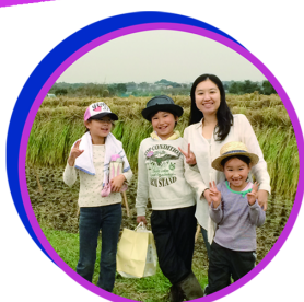
「NPO法人 水のフォーラム」では見沼田んぼ保全活動に従事